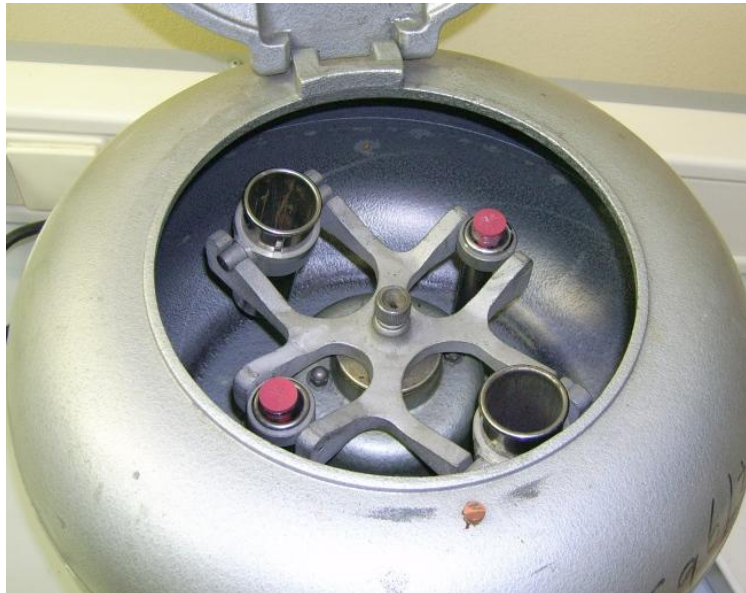
Slika 1. Laboratorijski stroj za centrifugiranje.

U vježbi je najprije potrebno odrediti kako ovisi vrijeme centrifugiranja o broju čestica koje ostaju neistaložene u suspenziji