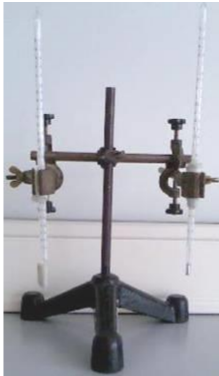
Slika 2. Psihrometar.

Psihrometar se sastoji od dva jednaka termometra. Jednom od njih spremište za termometrijsku tvar je omotano vlažnom krpicom.