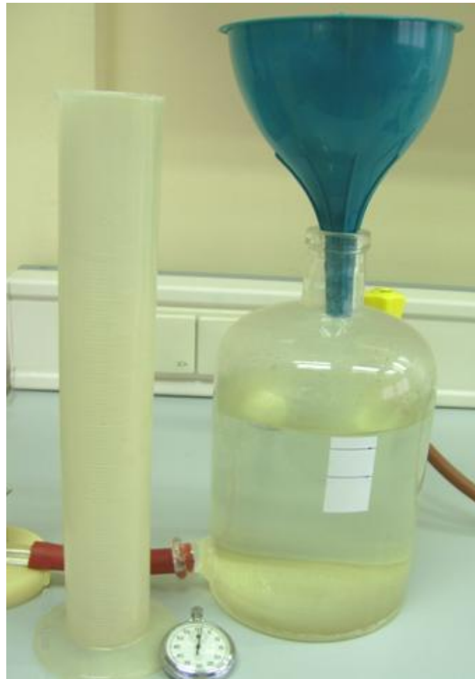
Slika 2. Pribor potreban za izvođenje mjerenja u drugom zadatku: posuda za vodu, lijevak, zaporni sat, menzura, cijevi, slavina.