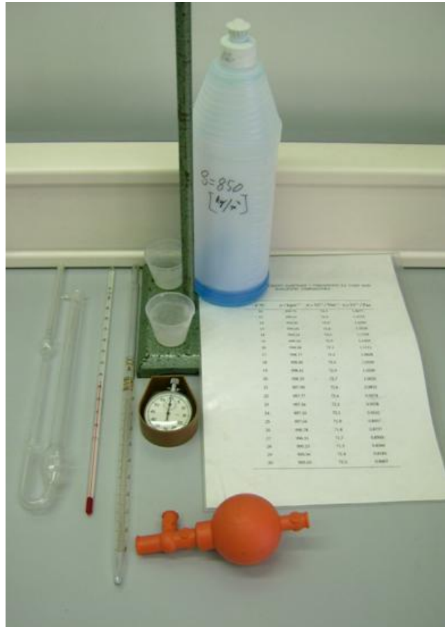
Slika 3 Pribor potreban za izvođenje vježbe: Ostwaldov viskozimetar, termometar, pipeta, gumena pumpa za pipetu (propipeta), zaporna ura, 2 čaše, stalak sa držačem, destilirana voda, zadana tekućina, tablica sa vrijednostima gustoće i viskoznosti destilirane vode pri različitim temperaturama.